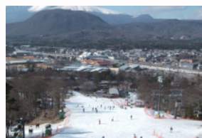
軽井沢プリンスホテルスキー場