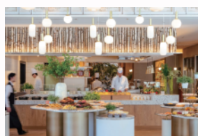
ホテルハーヴェスト旧軽井沢