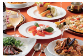
トラットリア プリモ