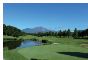
軽井沢72ゴルフ南コース